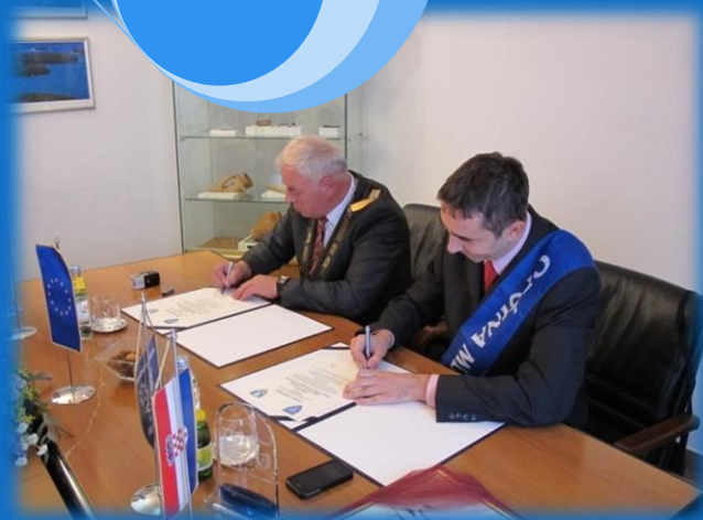
Podpis listine o pobratenju v Medulinu