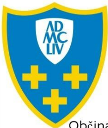
Občina Cerklje na Gorenjskem