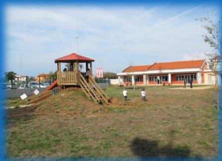
Vrtec v Medulinu