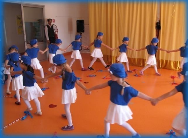
Malčki se predstavijo